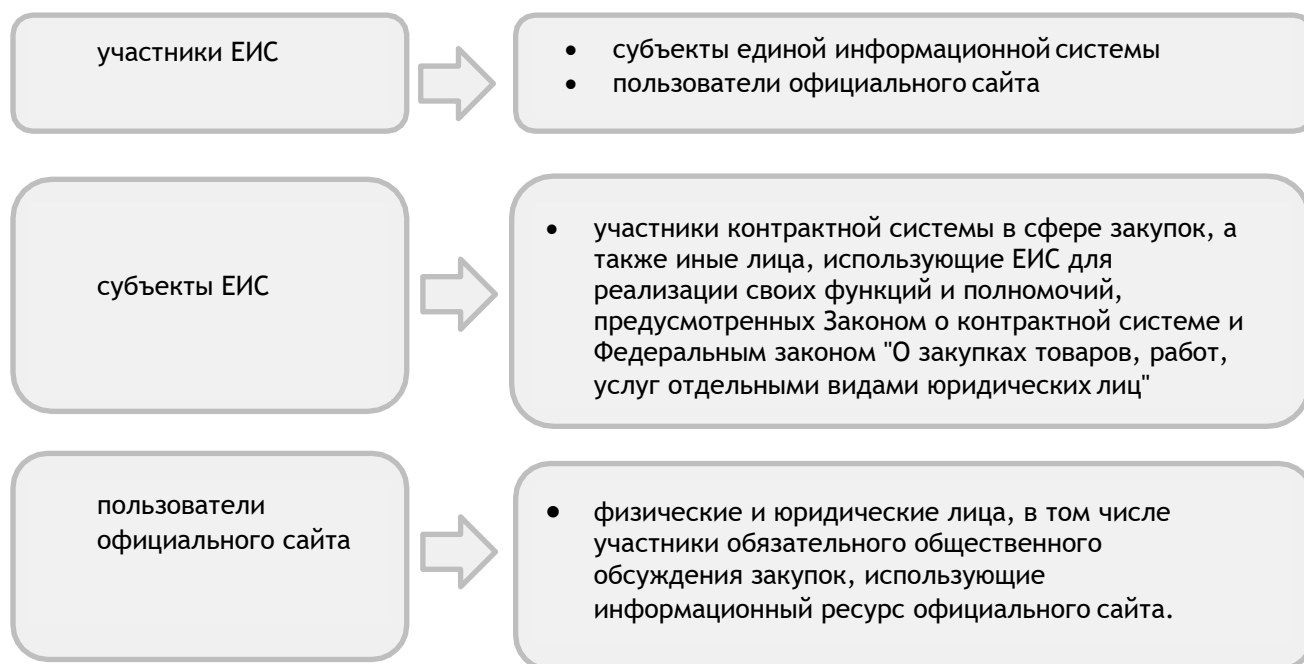
Рис.1 Терминология ЕИС

В соответствии с Федеральным законом от 05.04.2013 № 44-ФЗ «О контрактной системе в сфере закупок товаров, работ, услуг для обеспечения государственных и муниципальных нужд» (далее - Закон о контрактной системе) ЕИС - это совокупность информации, указанной в части 3 статьи 4 данного закона и содержащейся в базах данных, информационных технологий и технических средств, обеспечивающих формирование, обработку, хранение такой информации, а также ее предоставление с использованием официального сайта единой информационной системы в информационно-телекоммуникационной сети "Интернет".